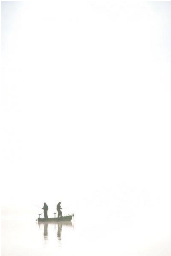
La brume magique du Matin à Saint Michel !